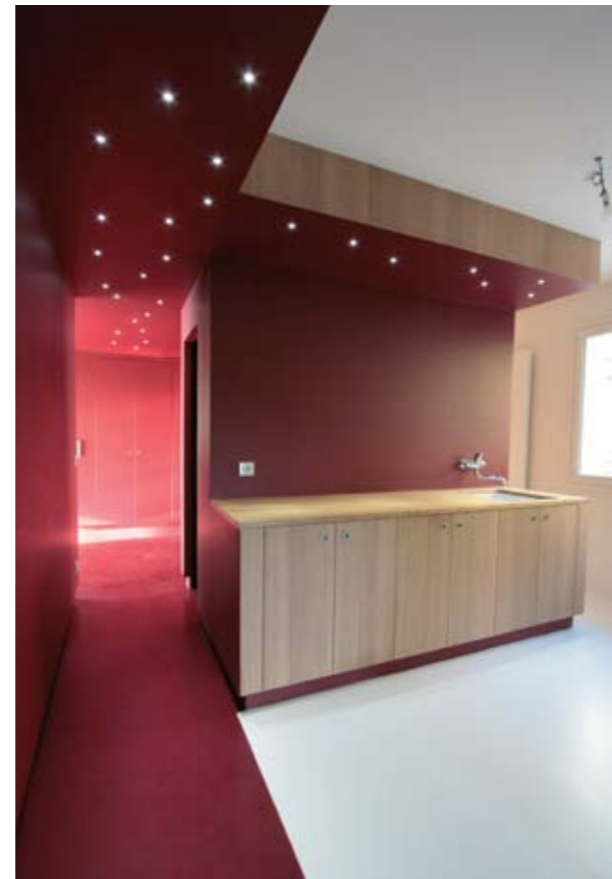
From left to right, from above to below: Driveway to villa, View from the living room, Loft on the upper floor, Kitchen. Right: Staircase to loft.